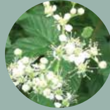
セイヨウナツユキソウ